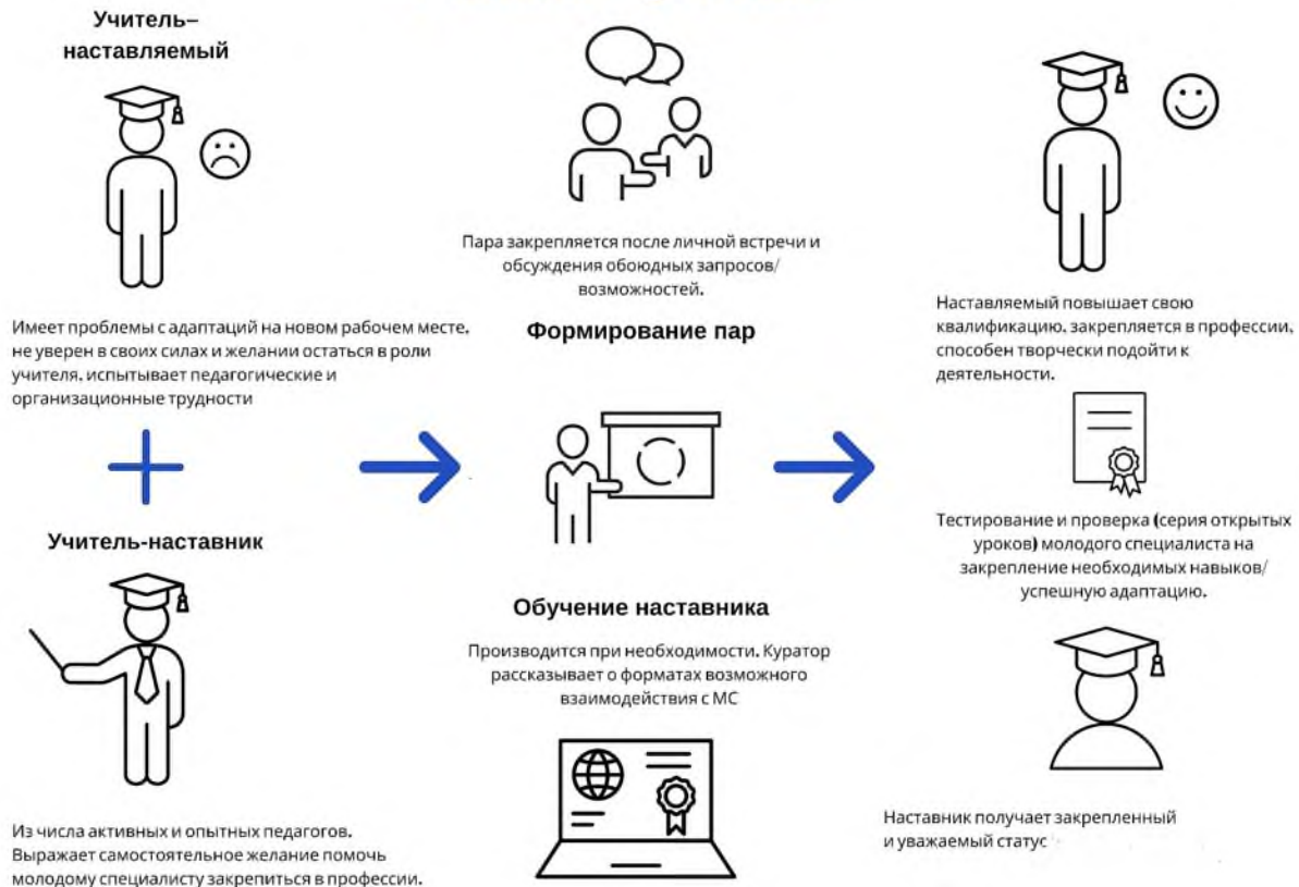
Рисунок 2. Графическое представление взаимодействия по форме «учитель – учитель»