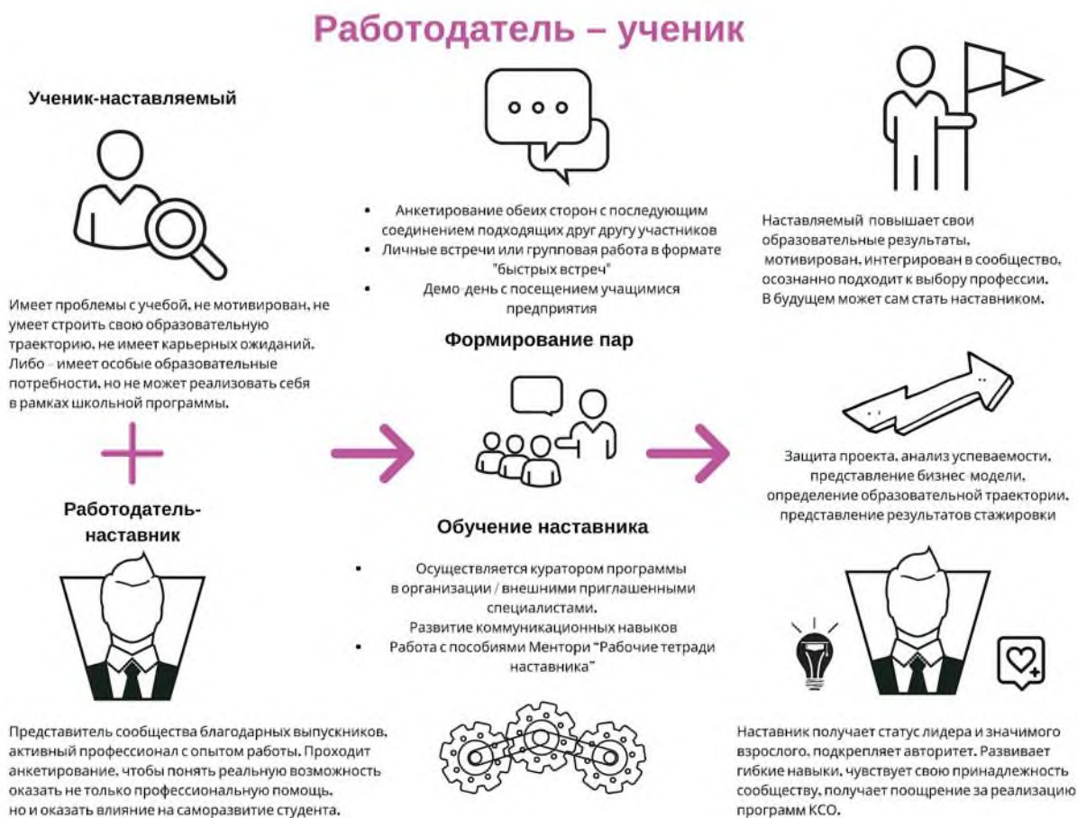
Рисунок 4. Графическое представление наставнического взаимодействия по форме «работодатель – ученик»