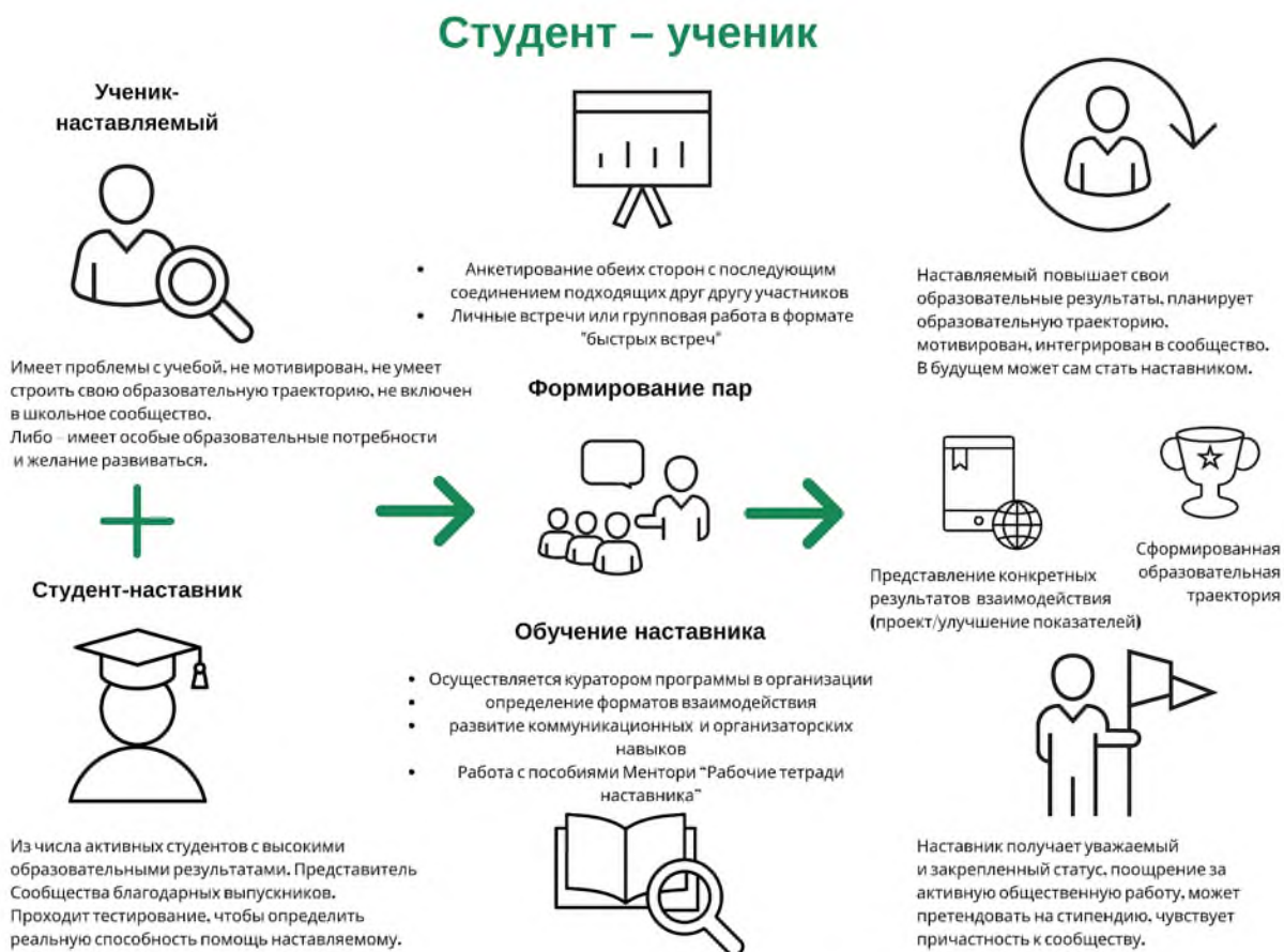
Рисунок 3. Графическое представление наставнического взаимодействия по форме «студент – ученик»