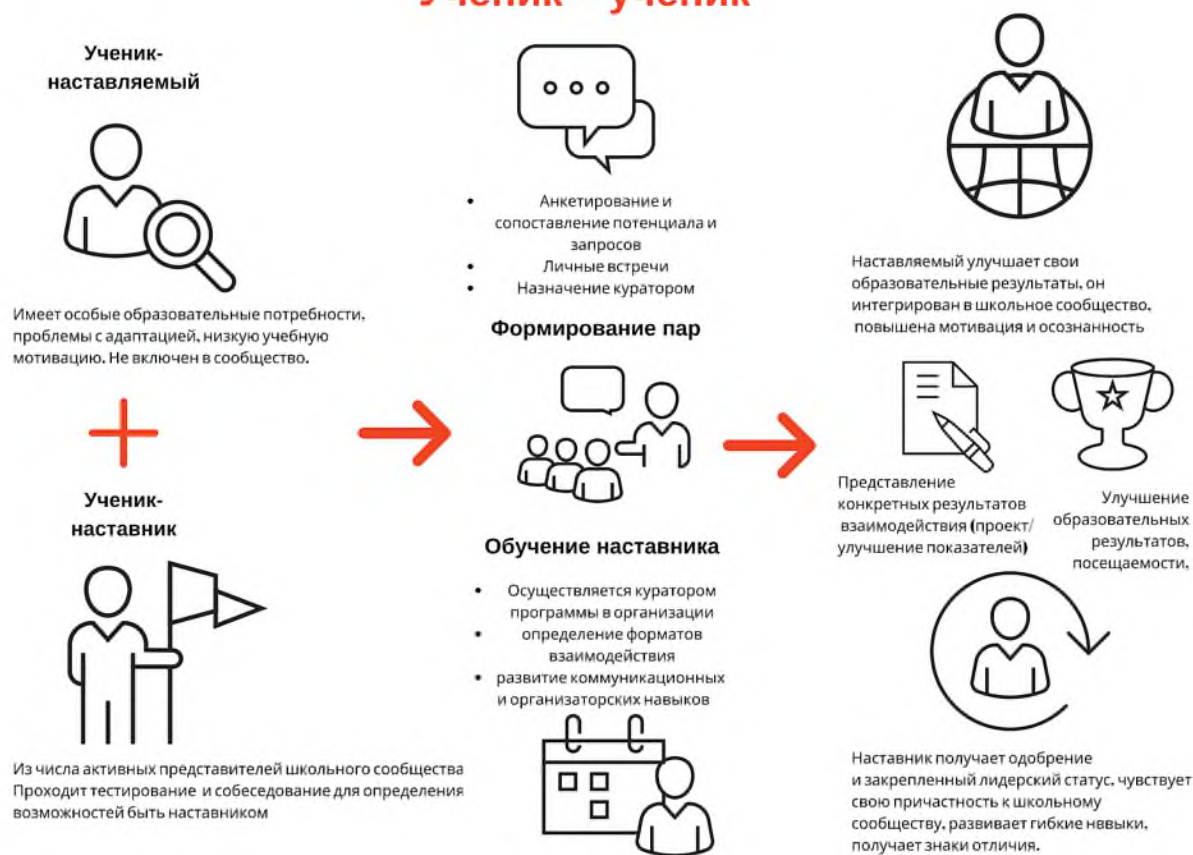
Рисунок 1. Графическое представление взаимодействия по форме «ученик – ученик»