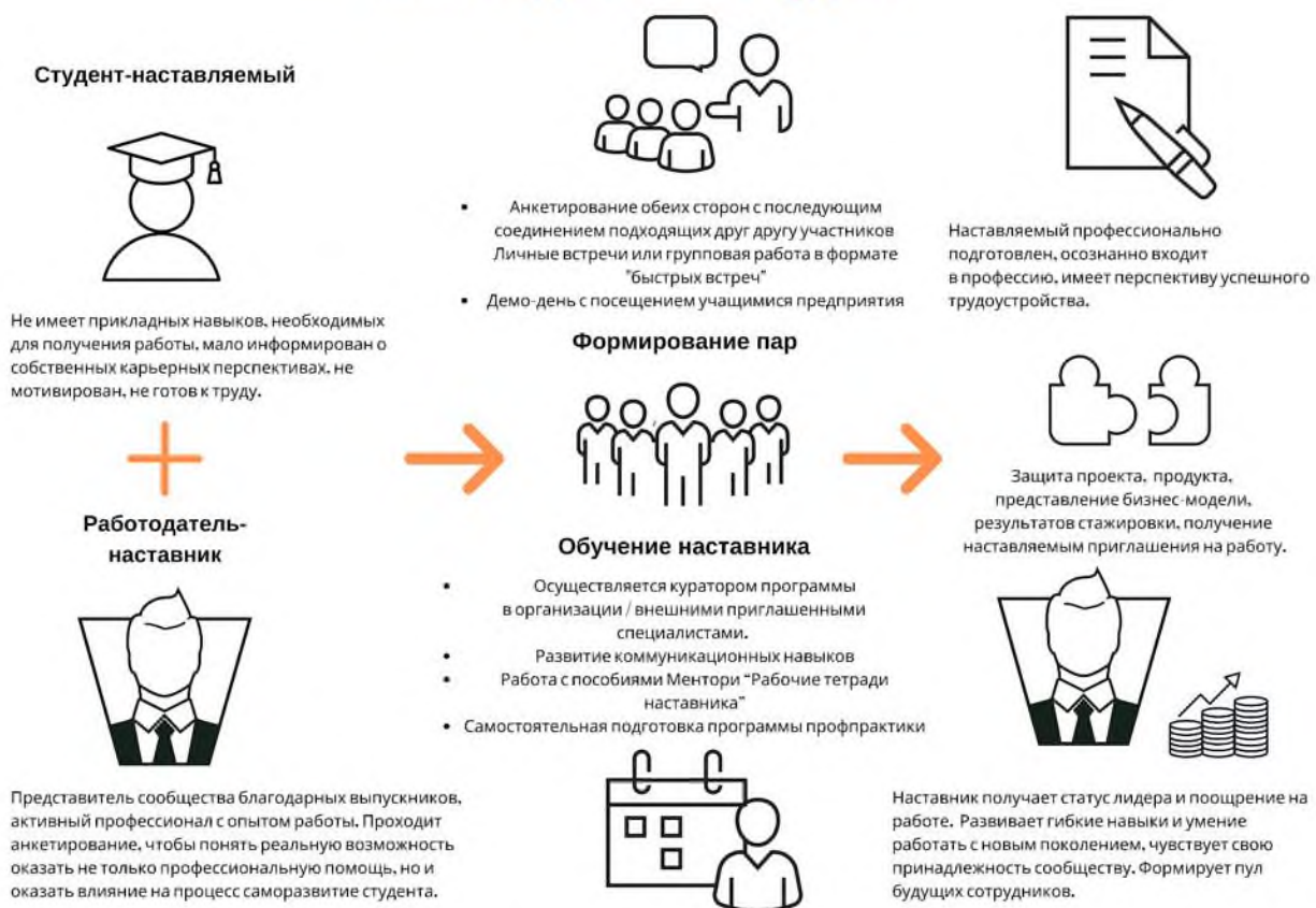
Рисунок 5. Графическое представление наставнического взаимодействия по форме «работодатель – студент»